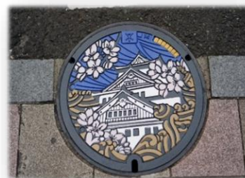
実際のマンホール