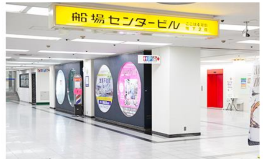
地下鉄（大阪メトロ）からビル内へ